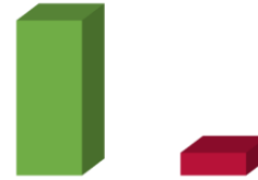
PREGUNTA 2 (Continuación de pregunta 1)