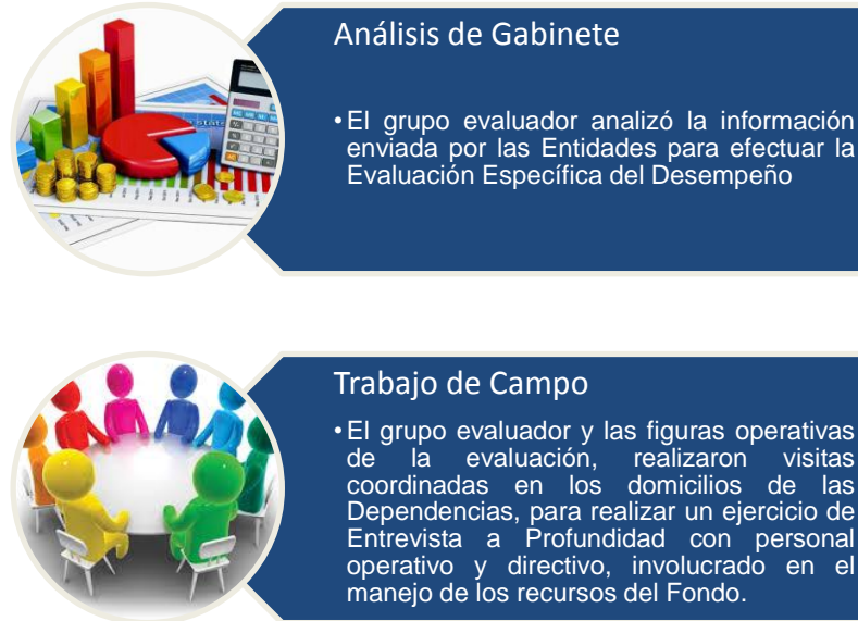
Figura 1. Evaluación de gabinete y de campo