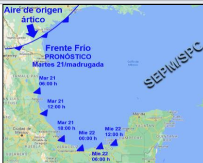
Pronóstico de avance del F. Frío (11)

PRONÓSTICO PARA EL ESTADO DE VERACRUZ: el potencial de lluvia y tormentas (ráfagas de viento y actividad eléctrica) aumenta durante martes 21 y miércoles 22, estimándose acumulados en 24 horas de 5 a 20 mm en promedio en el estado y máximos de 70 a 150 mm , en cuencas del sur (ver tabla). En este periodo, se prevé un Norte intenso con rachas máximas de 95 a 110 km/h en la costa central-sur, 70 a 95 km/h en la costa norte, menores, pero con rachas fuertes en llanuras, y de 55 a 70 km/h en la parte alta entre Xalapa-Naolinco-Misantla y valle de Perote (ver tabla), decreciendo gradualmente el mismo miércoles. Oleaje de 3.0 a 5.0 metros cercano al litoral y notable descenso de temperatura entre martes 21 y jueves 23. Pevio a estos efectos se pronostica una Surada con rachas máximas de 55 a 70 km/h en las regiones de Perote, Orizaba, los Tuxtlas y entre Jesús Carranza-Acayucan.