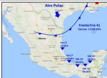
Pronóstico de avance del FF41

Pronóstico del paso del Frente Frío 41 e inicio del viento del Norte para los siguientes puertos (el viento puede cambiar antes por una Línea de Cortante).